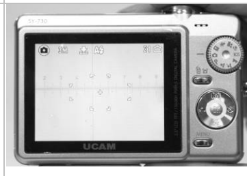
6. 刻度線在相機螢幕上呈水平狀態