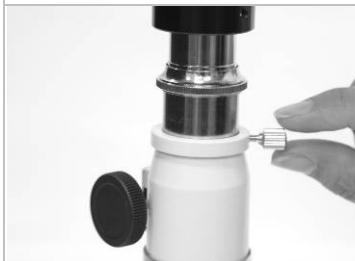
13. 確認限位固定環未鎖死。