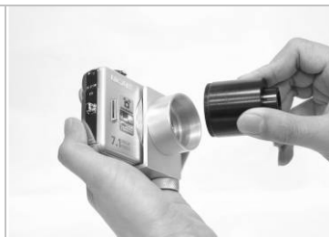
2. 將相機接上數位鏡頭並旋緊