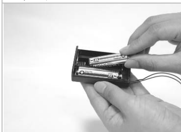
9. 電池盒裝上 3 號電池 3 顆。