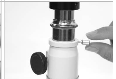
16. 在影像清晰的情況鎖緊固定環。

NOTE: 1. SM40 手持式高倍數位顯微鏡, 每小格代表實際尺寸 1/40mm (25 μm)。