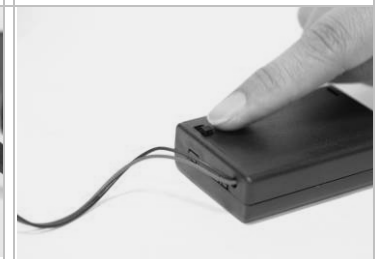
12. 將電源開啓 ON。