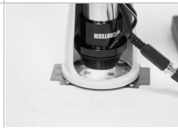
11. 顯微鏡平放待測物體上。