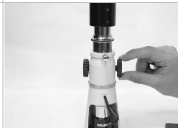
14. 調整調焦輪使影像清晰。