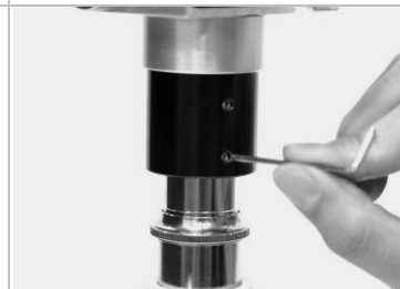
15. 鎖緊數位鏡頭固定螺絲。