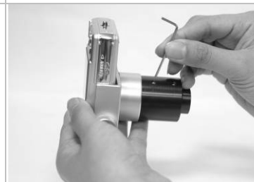
7. 鎖上目鏡固定螺絲。