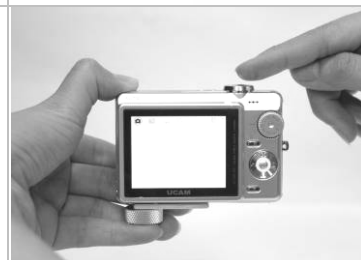
3. 打啓相機並使用相機放大功能調整至圓形黑邊消失。