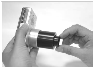
5. 旋轉並調整數位鏡頭使刻度線保持水平。