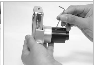
4. 使用六角板手轉鬆目鏡固定螺絲。